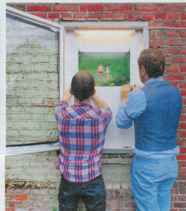
Trusefine: Bryllupsbildet der paret bare er iført undertøy ble hengt opp ved inngangen.